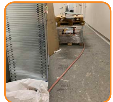
Protege contra la suciedad y los materiales