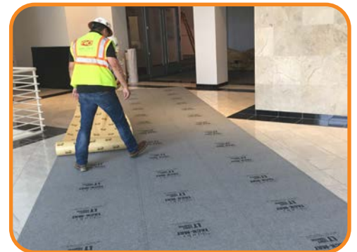
Fácil de aplicar

Tras extraer la alfombra adhesiva, la superficie quedará limpia y sin daños.