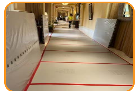
La versión de Fabric Back está disponible para proporcionar protección adicional.

Sistemas de protección de superficies innovadores y especialmente diseñados. Esto es todo lo que hacemos.