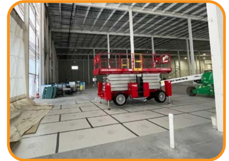
Protección contra alto impacto.