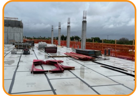
Resistente al agua, resistente a la ondulación y las deformaciones.