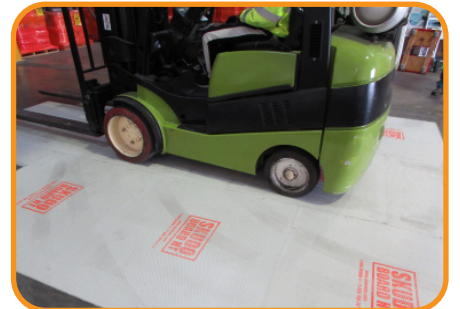
Protección superior bajo el tránsito de montacargas y de la construcción