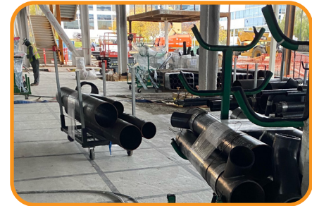
Ignífugo, resistente al agua y al deslizamiento