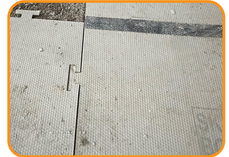
Extremadamente resistente a altos impactos.