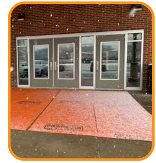
Es perfecta para áreas de alto impacto.