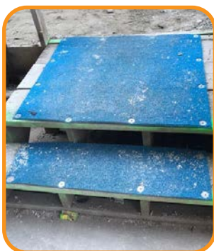
Superficie gruesa y resistente.