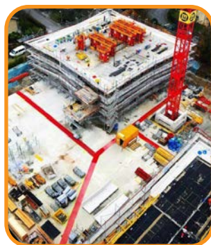
Es perfecta para trabajadores, contratistas y clientes.