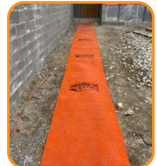
Se coloca sobre el barro y las rocas.