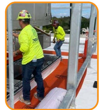
Tránsito seguro en el lugar de trabajo.

Sistemas de protección de superficies innovadores y especialmente diseñados. Esto es todo lo que hacemos.