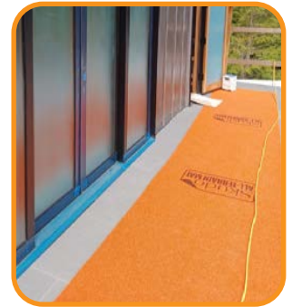
Atrapa la suciedad y los escombros.

Ahora disponible en naranja (estándar), azul y verde.