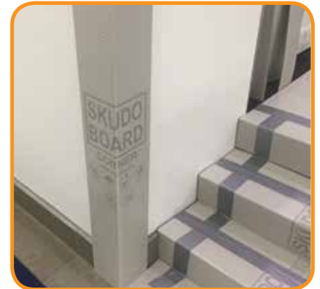
Protege bordes y escaleras