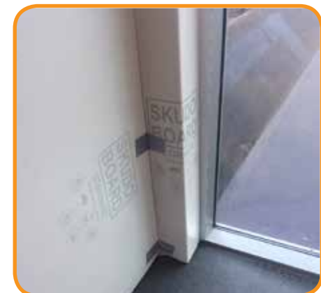
Liviano, fácil de manipular y reutilizable