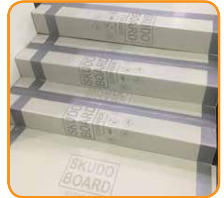
Resistente a altos impactos